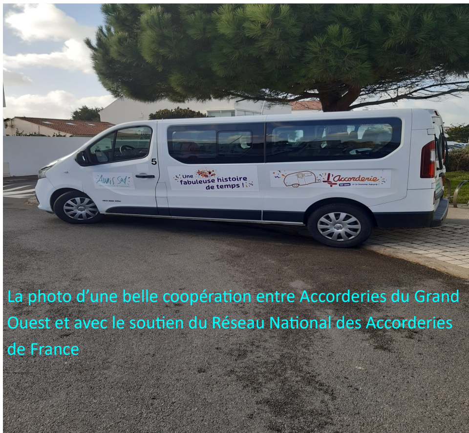
La photo d'une belle coopération entre Accorderies du Grand Ouest et avec le soutien du Réseau National des Accorderies de France

Une adresse à enregistrer : breve-go@accorderie.fr