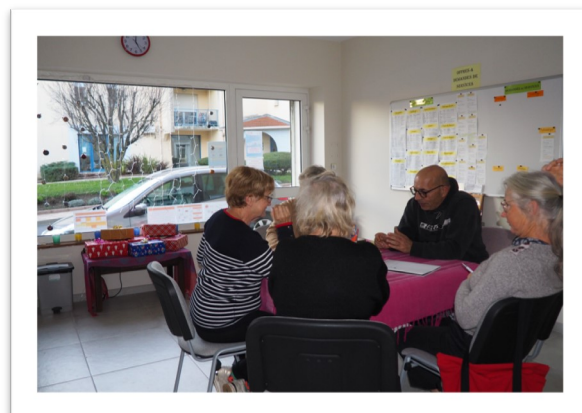
Une permanence du mercredi

Afin de permettre une rotation des membres qui tiennent la permanence, vous pouvez vous inscrire pour rendre ce service à l'Accorderie ! Ainsi, 2h vous seront créditées. Vous pouvez contacter l'animatrice pour vous inscrire sur la date qui vous convient.